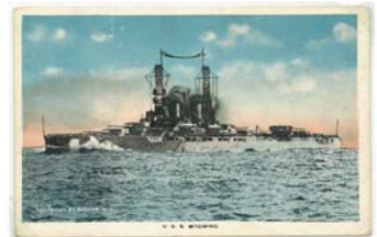
Postal sin usar, c. 1918. Impresor Muller, N.Y., sin número de postal. Acorazado USS Wyoming.