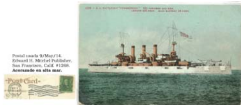
Postal usada 9/May/14. Acorazado en alta mar.