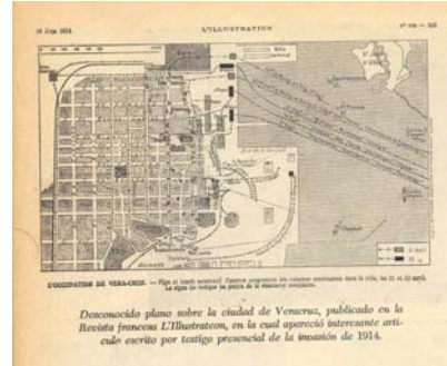
Desconocido plano sobre la ciudad de Veracruz, publicado en la Revista francesa L'Illustration, en la cual apareció interesante artículo escrito por antiguo prisionero de la invasión de 1914.