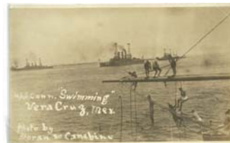
Postal fotográfica c. 1914 sin usar. Marinos del USS Conna. zedando. Imagen de otros buques del bloqueo al fondo. Sin fecha.

ES UN TRISTE EPISODIO DONDE NO HUBO UN TRIUNFO PARA NADIE.