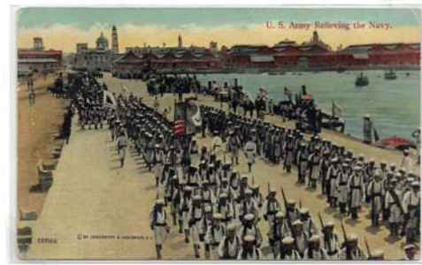
Soldados y marines americanos desfilando en el muelle tras la caída del puerto, Mayo 5, 1914. Postal impresa por The Valentine Souvenir Co., N.Y.; Postal #220166