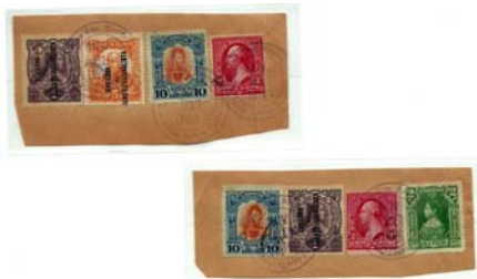
EJEMPLOS DE USOS FILATELICOS (SOUVENIRS) FECHADOS UN DÍA ANTES DEL RETIRO DE LAS FUERZAS DE OCUPACION DEL PUERTO DE VERACRUZ.