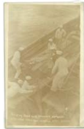
Postal fotográfica sin usar. Regimiento asustado y huyendo al 19 de ABRIL - 21/04/1914. Foto general de la figura. No hay más datos.