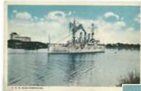
Postal de la época sin usar. No se indica casa impresora, ni número.