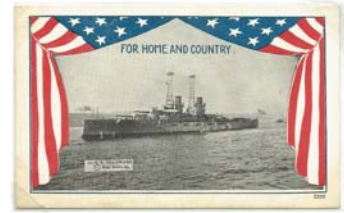
Postal patriótica sin usar, c. 1918. Serie "FOR HOME AND COUNTRY". Pict. News Corp. USA. #2200. Acorazado USS Delaware.