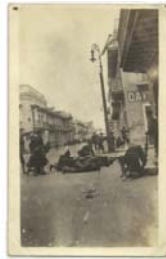
Postal fotográfica sin usar. Lechando en las calles 21/04/1914. Foto general de la figura. No hay más datos.